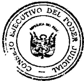
FRANCISCO TÁVARA CÓRDOVA